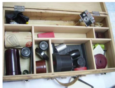
Utensilios de su laboratorio.

Esta exposición es una oportunidad para realizar una visita por el Villadiego del año 1949 al 1961 y a su vez disfrutar, recordar, analizar, comparar, etc. solo o acompañado.