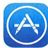
App Store en Apple