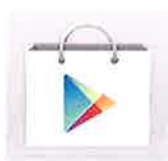
Google Play si es Android

Esperar a que te hayan metido en la base de datos del Ayuntamiento y después descargar la APP entrando en nuestro teléfono en: